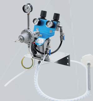
sur EQUERRE MURALE