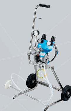
sur CART AVEC ROUES