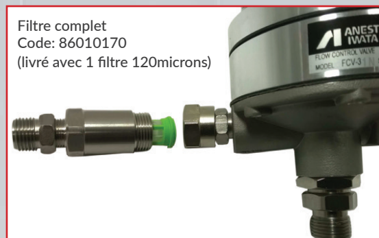
Filtre complet Code: 86010170 (livré avec 1 filtre 120microns)