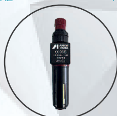
RÉGULATEUR AVEC FILTRES 5µM CHARBON