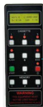
Platine électronique de contrôle.